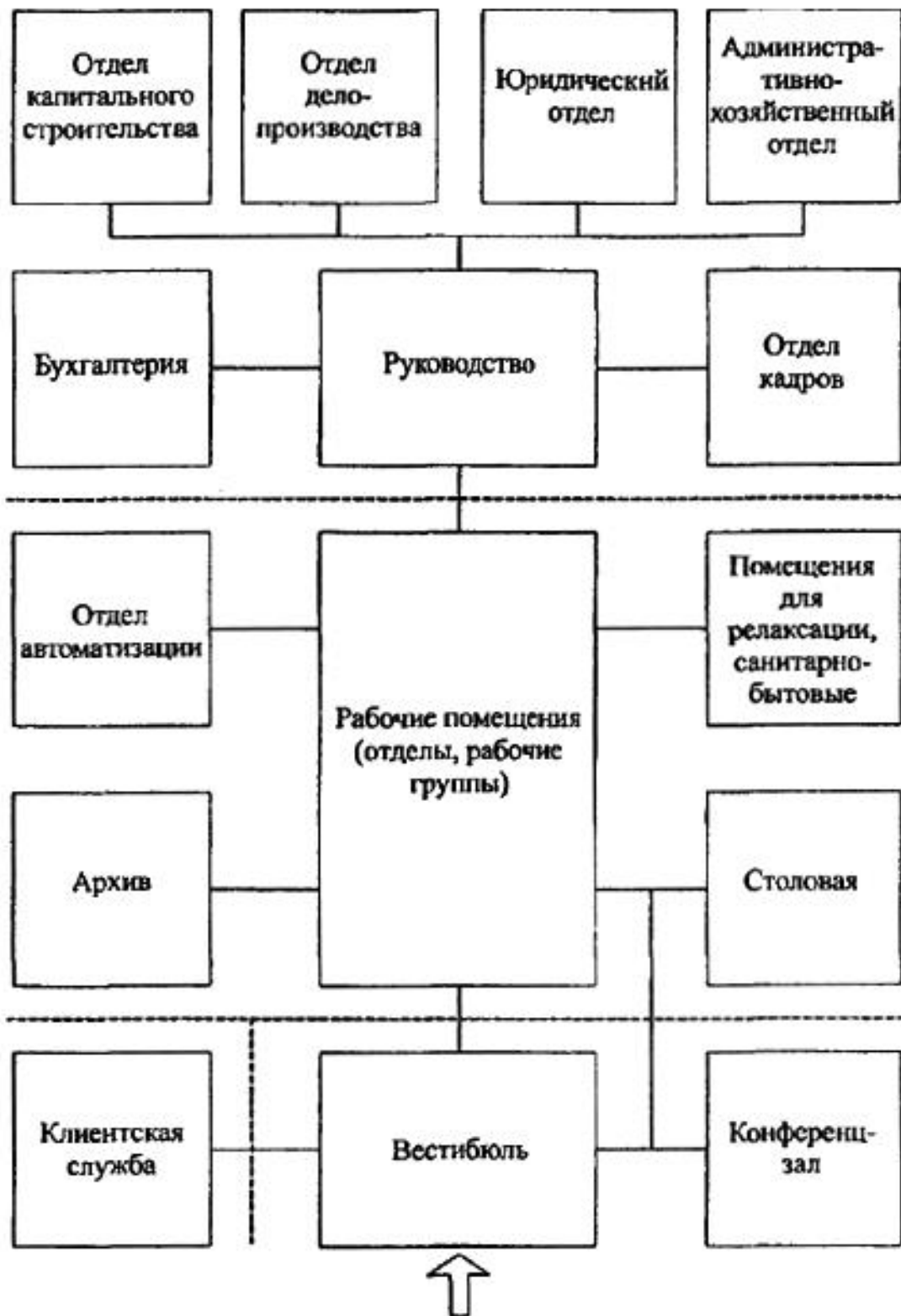
Рисунок 8.2 - Схема взаимосвязи основных групп помещений административных зданий ПФР.