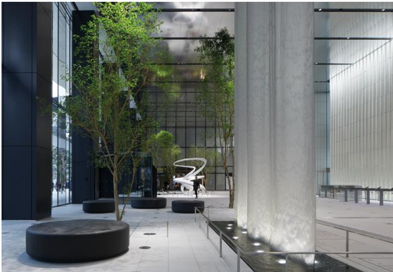
Бизнес-башня Toranomon Hills, Токио, Япония, от Sirius Lighting Office, обладатель награды Radiance Award на церемонии вручения наград Международной ассоциации дизайнеров по свету 2021 года: объем пространства продолжает приобретать все большее значение с упором на освещение вертикальных поверхностей и объектов.

мерцания IEC (PstLM). Мерцание воспринимается глазом на частоте ниже 80 Гц. Стробоскопические эффекты могут быть объективно определены количественно с помощью метода измерения стробоскопической видимости (SVM). Не следует превышать PstLM, равный 1, и SVM, равный 0,9. С 2023 года лимит SVM будет снижен до 0,4.